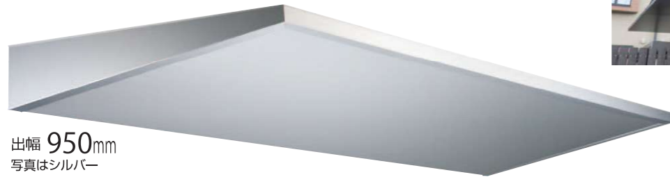
出幅 950mm 写真はシルバー