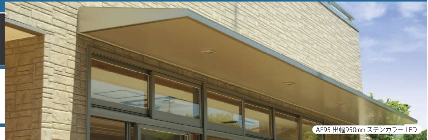
AF95 出幅950mm ステンカラー LED

AF95は製品単体を3Dでご覧いただけます。下記のQRコードよりアクセスしてください。