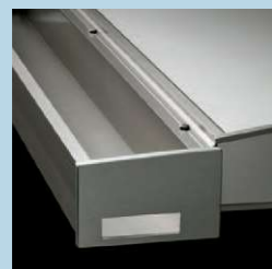
たてどいの落とし口なし (標準仕様)