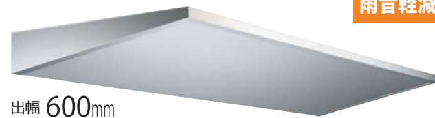
出幅 600mm 写真はシルバー