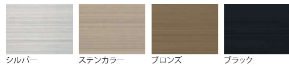
シルバー ステンカラー ブロンズ ブラック