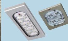
オプションでLED照明の取付も可能です。 ※詳細はP49・P50をご覧ください。