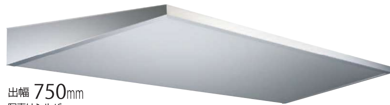
出幅 750mm 写真はシルバー